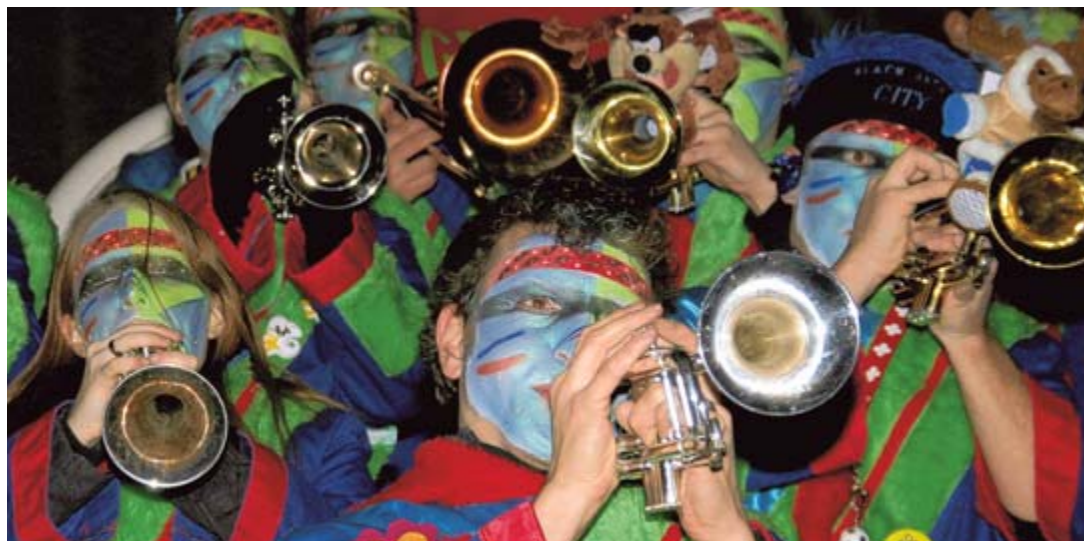
Mit ihren fetzigen Rhythmen begeistern die Guggenmusiken am morgigen Samstag beim Görwihler Nachtumzug das Publikum. Danach ist Mega-Party in der Hotzenwaldhalle.